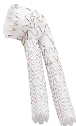
ゴア® エクスクルーダー® コンフォーマブル AAAステントグラフト アクティブコントロールシステム