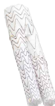
ゴア® エクスクルーダー® IBE