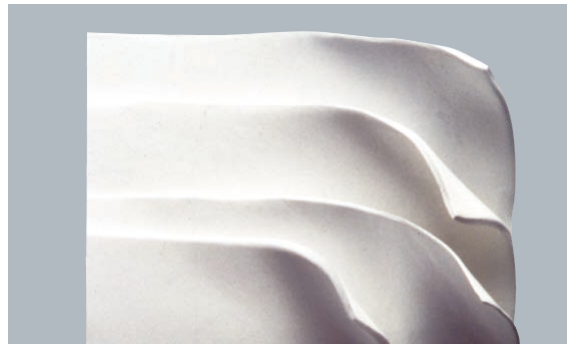
ゴアテックス® ソフトティッシュパッチ 1 mm厚、2 mm厚

筋層の修復に用いられる組織補強材料には強度が求められ、長期間インプラントされても劣化が少なく、高い強度を保つ必要があります。ゴアテックス® ソフトティッシュパッチは100% ePTFE の多孔質構造からなる1 mm もしくは2 mm 厚のシート材で、高い強度および柔軟性を持つように設計されています。